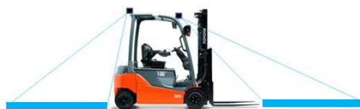
Segnalazione anticipata anteriore e posteriore